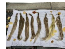
Årlig tävling i linrötning med dokumentation